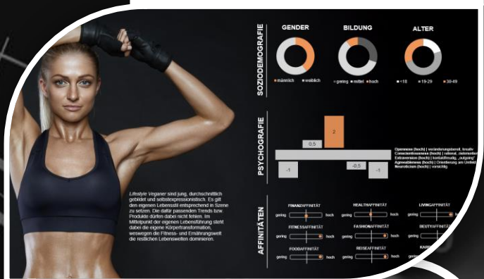
Personen die Gender Pay Gap suchen sind besonders karriere- & fitness/kraftsport-affin

Mit unserer Reihe „Starke Finanzen für Starke Frauen“ haben wir nicht nur ein umfassendes Verständnis für die Bedürfnisse von Frauen in der Gen Z/Y aufgebaut, sondern auch passgenaue Lösungen entwickelt, die die finanzielle Selbstwirksamkeit & Resilienz von Frauen fördern & dabei das User Engagement nachweislich exponentiell steigern.